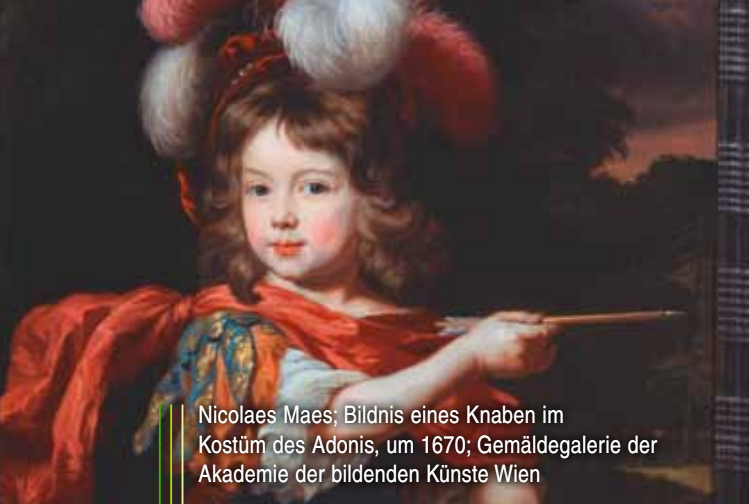
Nicolaes Maes; Bildnis eines Knaben im Kostüm des Adonis, um 1670; Gemäldegalerie der Akademie der bildenden Künste Wien